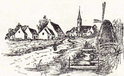
Polderdorp in Zeeuwsch-Vlaanderen.

Van op den toren toont Sluis zich als een rustig, bijna verlaten stadje. 't Oog volgt straten, gevormd door blinde muren, nauwelijks onderbroken door een of meer huizen. Sommige woningen zijn eigenlijk hoeven met stal en schuur op de ruime binnenplaats. Overal ziet men teekenen van verval. En geen wonder! Sluis heeft tal van belegeringen en bestormingen moeten doorstaan.