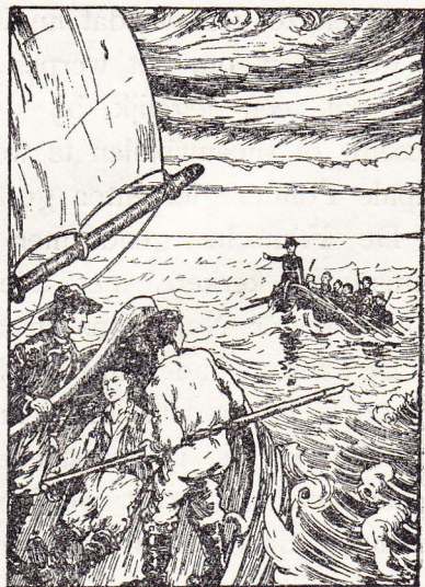
Strijd tusschen smokkelaars en Franschen.