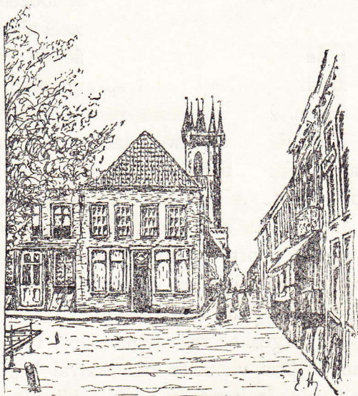
Stadhuistoren te Sluis.

openden we een deurtje en stonden we bij de klokken. Er hangen er vijf in den toren; de groote is de oude stads-, de zegeklok en draagt voor opschrift „Victor es minen name.” Ze wordt thans alleen geluid op de verjaardagen van 't koninklijk huis en bij plechtige gelegenheden. In een der klokkegaten staat een houten mannetje met een ijzeren hamer, nevens drie kleine klokken, welke boven elkaar hangen. Dat ventje heet „Jantje van Sluis.” Voor de klok