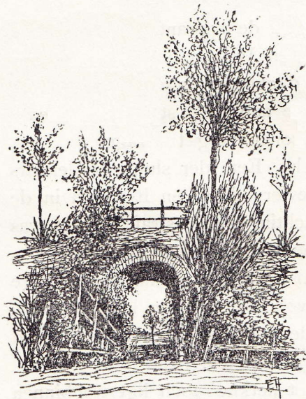
Puin eener poort te Sluis.

zoeken. Even poosden we bij den Wilhelmina-boom, geplant ter herinnering aan de kroning van Neerlands vorstin, en gingen vervolgens door de Kapellestraat. Hier bemerkten we een huis der 16 eeuw met trapgeveltje en het nette postkantoor, met zijne levendige kleuren. Spoedig stonden we weer op de wallen, nu aan de andere zijde der stad. De ruïne van eene oude poort trok onze aandacht. Ze dient nu voor wagenhuis! Sluis bezit nog twee overblijfselen van voormalige poorten: de steenen Beer, eene oude waterpoort, en de Westpoort, waar-