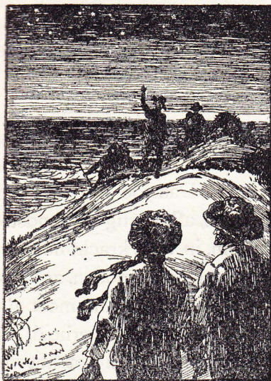
Smokkelaars in de duinen.